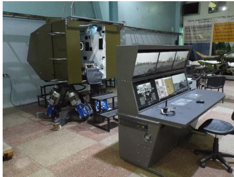
Динамический тренажер механика-водителя БМП-2