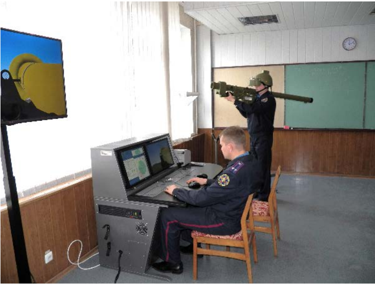
Тренажер стрелка-зенитчика ПЗРК «Игла»