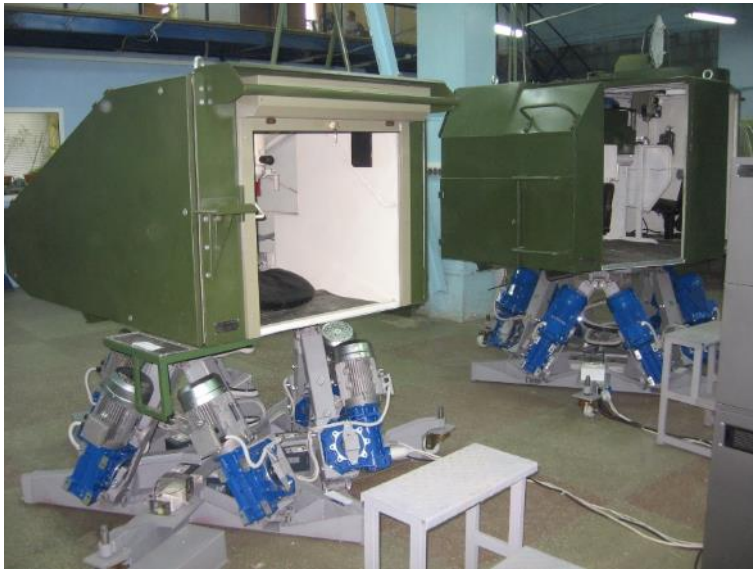
Динамический тренажер экипажа танка Т-72