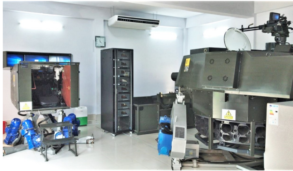
Динамический тренажер экипажа танка MBT-2000