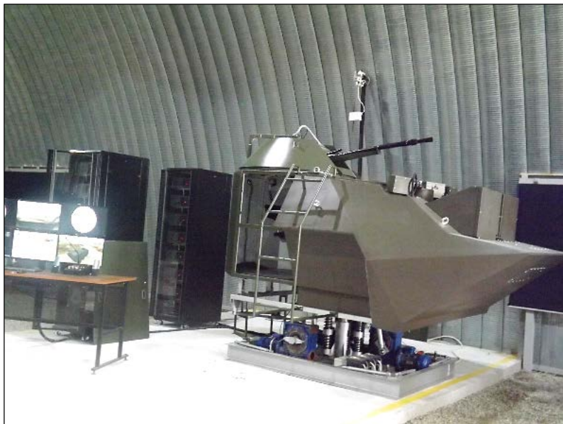
Динамический тренажер экипажа БТР-80