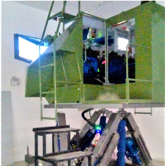
Динамический тренажер экипажа БТР-3Е1