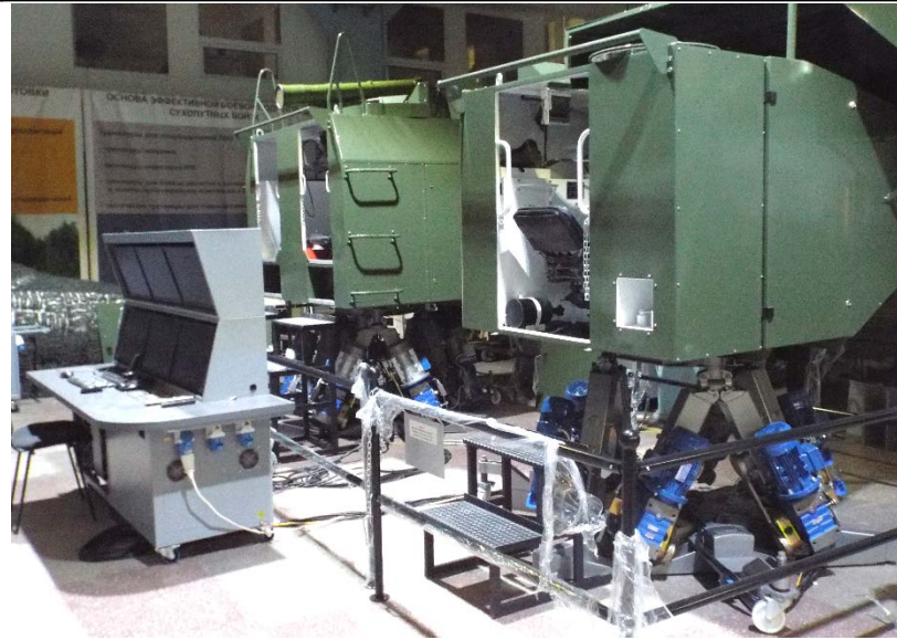
Динамический тренажер экипажа БМП-2