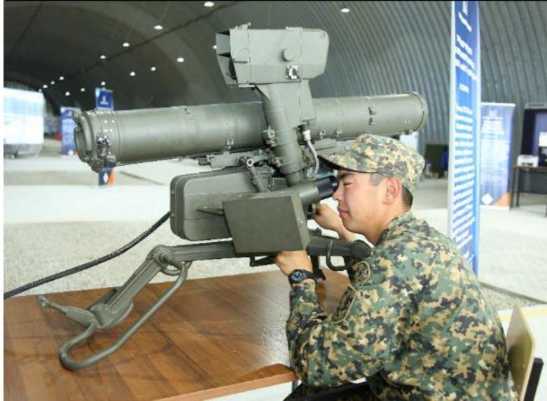
Тренажер оператора противотанкового комплекса «Фагот»