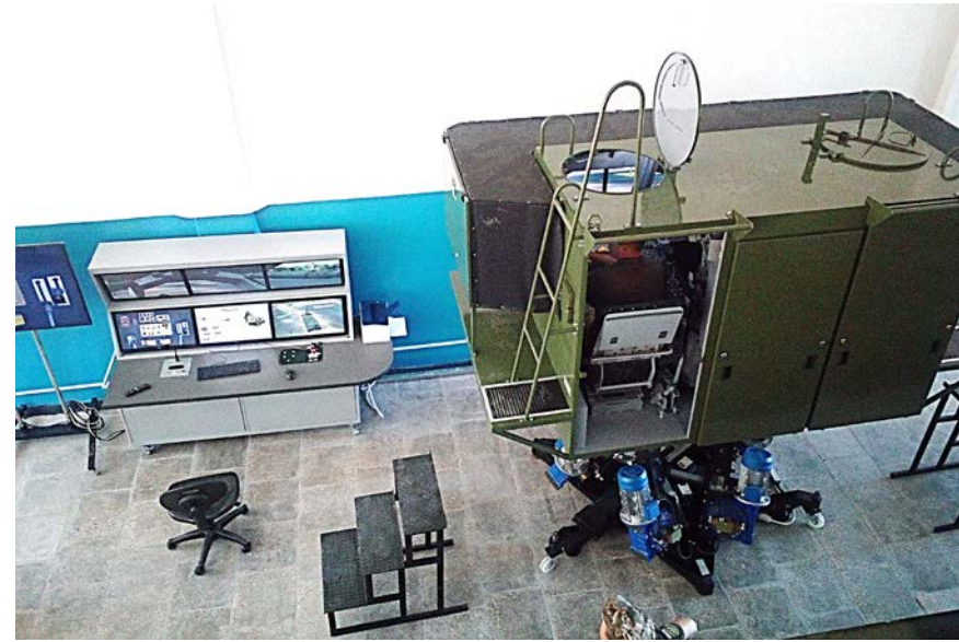
Динамический тренажер механика-водителя БАТ-2